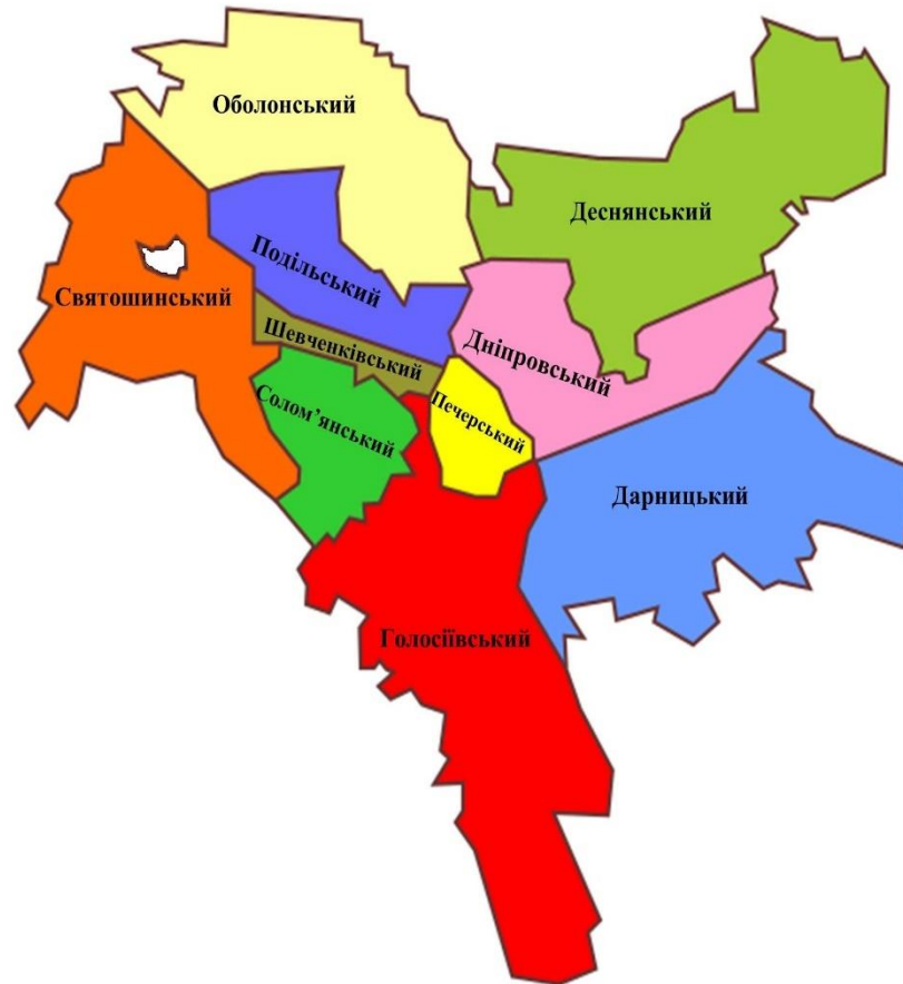
Адміністративна карта міста Києва